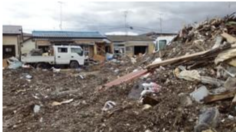
泥だらけだった4月の石巻市

4月18日～22日まで宮城県石巻市、5月16日～20日まで宮城県東松島市、6月13日～17日まで宮城県東松島市及び南三陸町